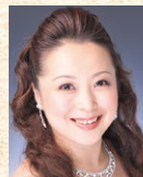
栗田真帆 (メゾソプラノ)