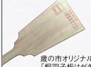
歳の市オリジナル「桐羽子板はがき」

浅草寺を中心とするエリアをぐるっとめぐり、5個の押印を集めて浅草寺福小路にゴールした方に、先着で歳の市にちなんだ景品を贈呈いたします。 会場／浅草寺福小路、浅草伝法院通り商店街、浅草観音通り商店街、観音通りメトロ商店街、他