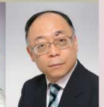
松井康司 (バリトン)