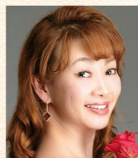
木村未希 (ソプラノ)