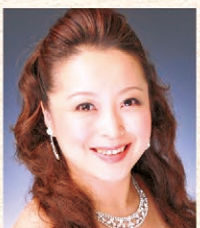
栗田真帆 (メゾソプラノ)