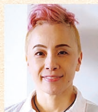
橋本美香 (ソプラノ)